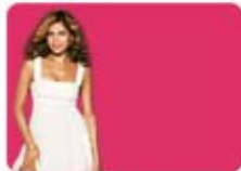
VAPODI SE NA COSMO